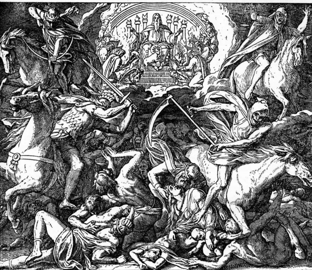
Beránek otvírá prvních šest pečeti. Zj. 6, 1. - 17.

oblečena v jemné plátno, bílé, čisté... Na rouchu, a to na bedru svém, má napsáno: Král nad králi a pán nad pány“. Zjev. 19, 11 — 16 Tu Ježíš Kristus již není sám. Doprovází Ho spolubojovníci, kterým dal podíl na boji i na vítězství nad národy.