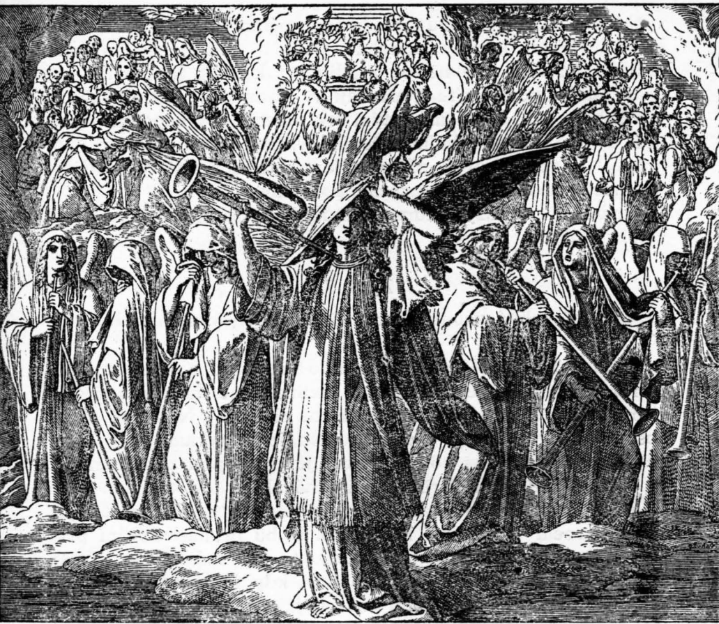
Vidění sedmi andělů se sedmi troubami. Zj. 8, 2 - 11, 19.

Symbyly vzaté z přírody, ale neoznačující zjevy přírodní, nýbrž dějinné události.